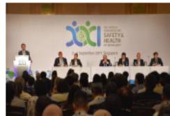
Από το 21ο παγκόσμιο συνέδριο για την Υγεία & Ασφάλεια στην Εργασία, 2- 6 Σεπτεμβρίου στη Σιγκαπούρη, με την συνδιοργάνωση της ΔΟΕ και της International Social Security Association (ISSA)

Σύμφωνα με τα στοιχεία που παρουσιάστηκαν στο φετινό παγκόσμιο συνέδριο για την Υγεία και ασφάλεια στην Εργασία, πάνω από 2,7 εκατομμύρια άτομα πεθαίνουν κάθε χρόνο από ατυχήματα και ασθένειες που σχετίζονται με την εργασία τους. Τα 2,4 εκατομμύρια από αυτούς τους θανάτους αποδίδονται σε σοβαρές ασθένειες που προκλήθηκαν στην εργασία.