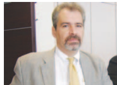
Του Δημήτρη Λιάτσου

Το μνημόνιο της ντροπής και της υποταγής υποθηκεύει το παρόν και το μέλλον το δικό μας και των παιδιών μας, η κοινωνική οργή δεν έχει ακόμα εκφραστεί, η ανασφάλεια και η κοινωνική φοβία μεγαλώνει μέρα με τη μέρα.